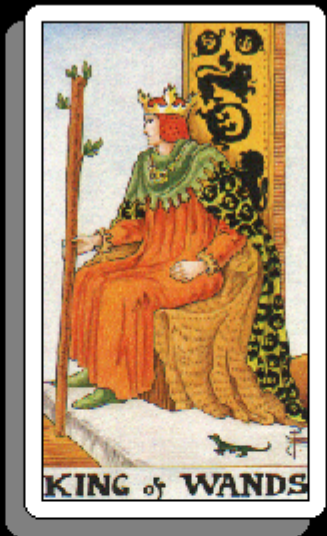
「 棒のキング 」