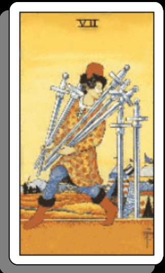
「 剣の7 」