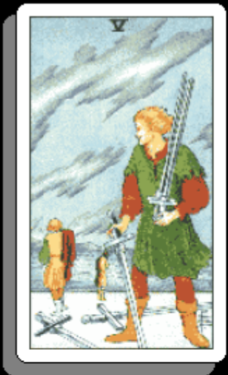
「 剣の5 」