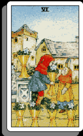
「 カップの6 」