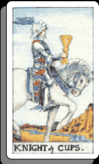
「 カップのナイト 」